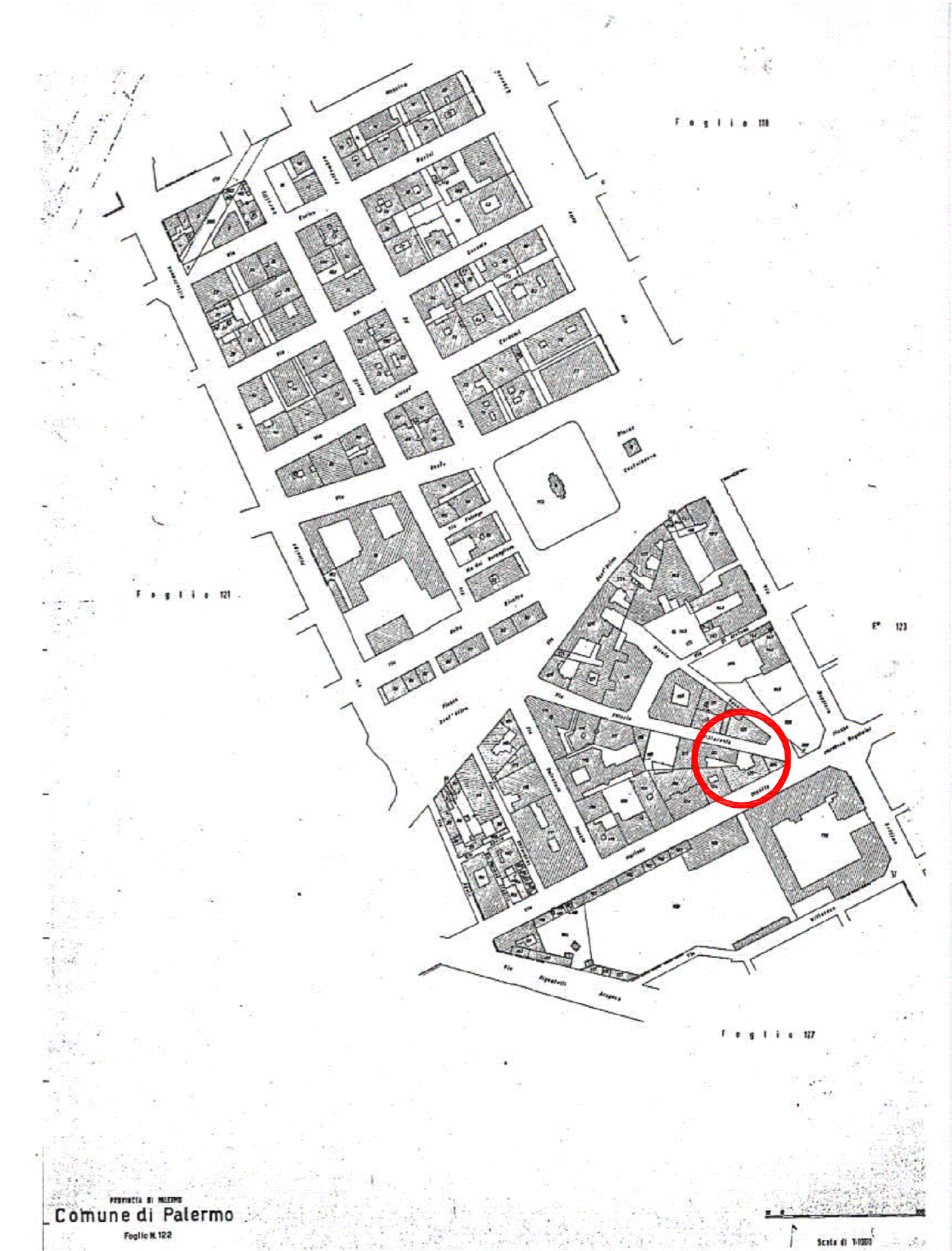
Stralci catastale foglio 122